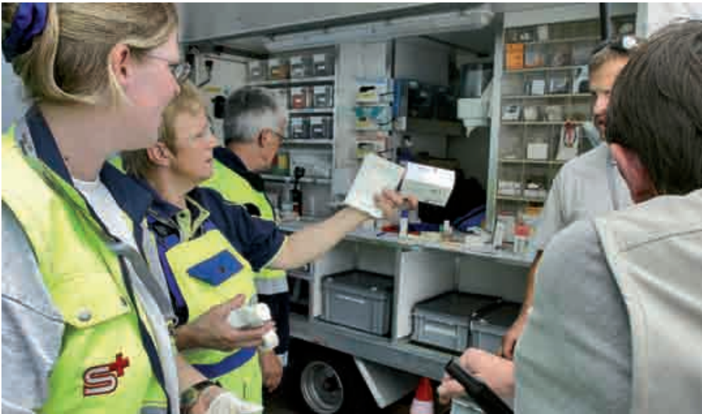
Samariter im Einsatz