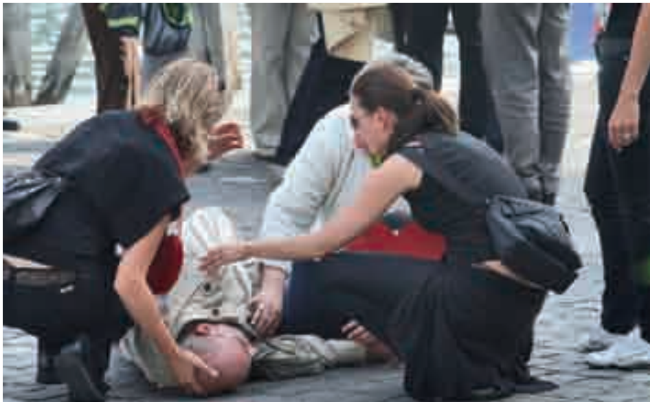
^ Beherzte junge Frauen kümmern sich rasch und engagiert um den Patienten v Helferinnen kümmern sich um den vermeintlichen Patienten und erleichtern ihm das Atmen

Erste Hilfe ist lernbar. Das beweisen tagtäglich 32'000 Mitglieder der Samaritervereine bei Sanitätsdienst-Einsätzen in Sport, Freizeit und am Arbeitsplatz. Ebenso bieten die Samaritervereine zertifizierte Ausbildungen und Kurse über das richtige und kompetente Verhalten im Notfall.