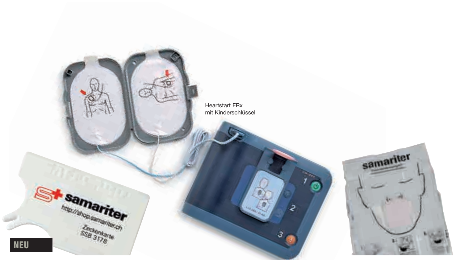
Heartstart FRx mit Kinderschlüssel

«Schnell und unkompliziert Sanitätsmaterial einkaufen» http://shop.samariter.ch